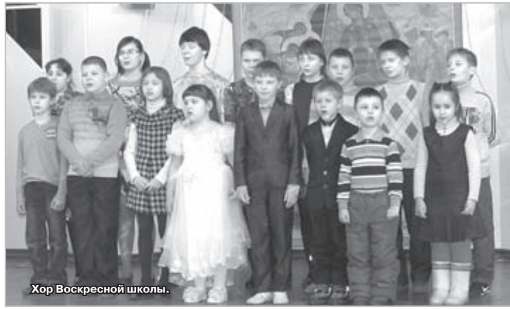
Хор Воскресной школы.