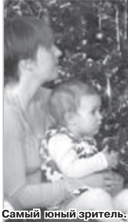
Самый юный зритель.

Особая прелесть данного праздника заключалась именно в этом: душевной, тихой радости. Восприимчивость она была очень хорошо, поскольку основную часть гостей праздника составляли родители с детьми, большинство из которых посещают Воскресную школу. Дети были самых разных возрастов, но даже самые ма-